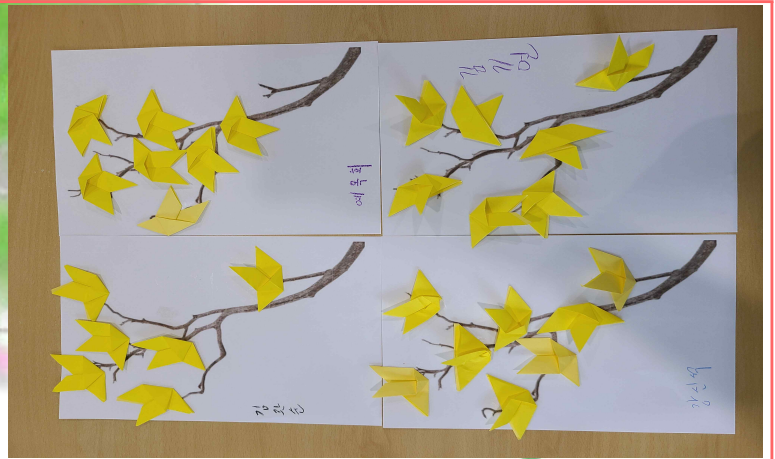
03/08 - 개나리 접기