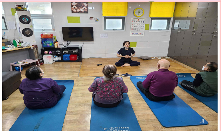
03/14 - 노인 요가