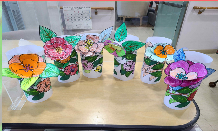
03/03 - 동백꽃 만들기