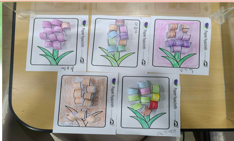
03/10 - 동그란 꽃 만들기