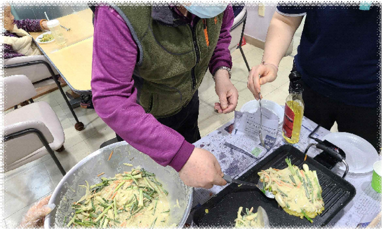
이/25 - 해물파전 만들기