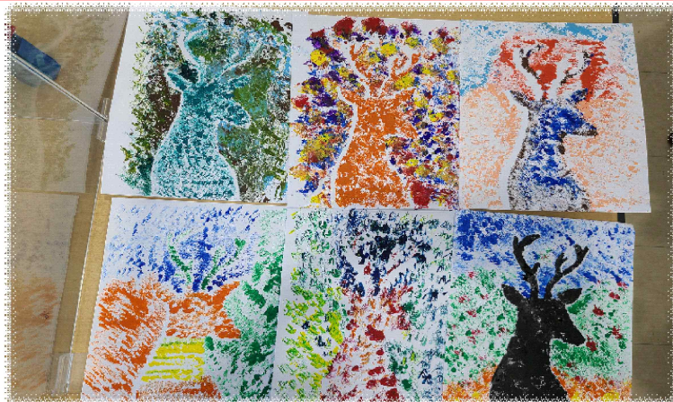
이/15 - 순록 스탠실