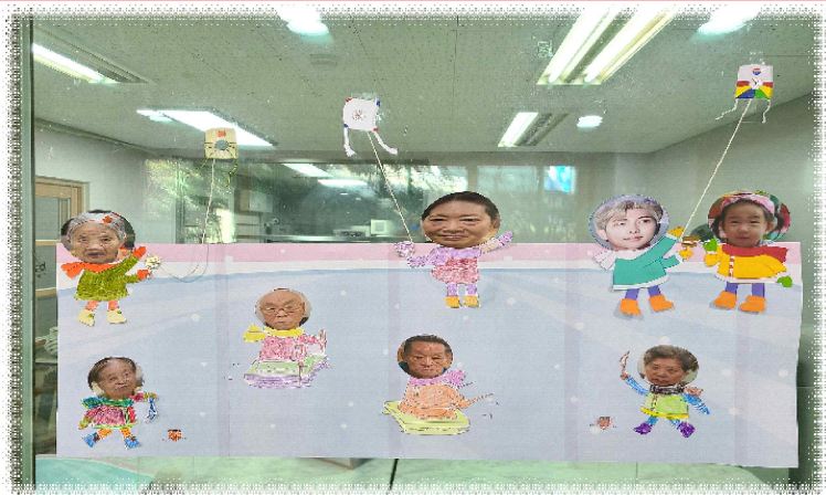
이/07 -겨울 환경판 꾸미기