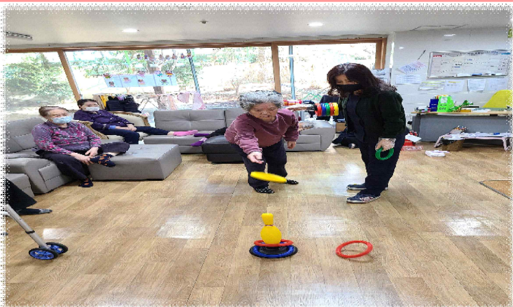
이/18 - 고리 던지기