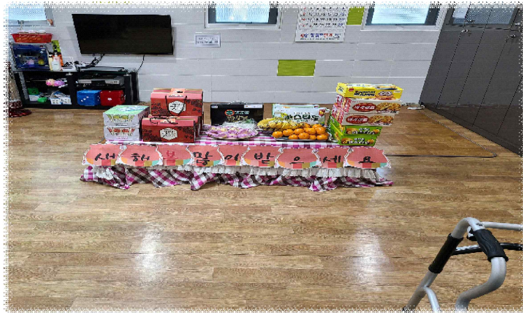
이/28 - 설날 행사

저희 느티나무 안심요양시설에서는 보호자님들의 말씀 한마디 한마디를 귀담아 듣고 어르신들을 가족과 같이 따뜻한 마음으로 섬김을 실천에 옮기는 곳이 되겠습니다. 많은 관심과 배려 부탁드립니다.