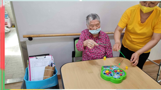
04/18 - 낚시 게임