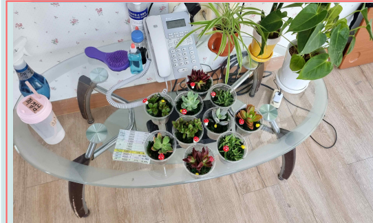
04/05 - 미니가든 만들기