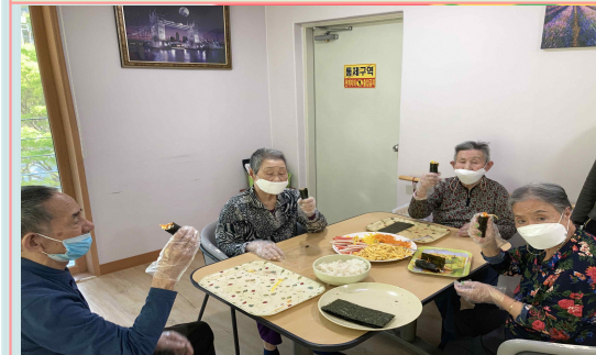
04/19 - 꼬마김밥 만들기