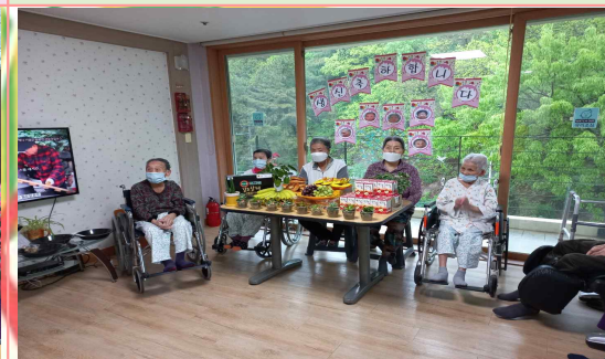
04/29 - 생신잔치

저희 느티나무 안심요양시설에서는 보호자님들의 말씀 한마디 한마디를 귀담아 듣고 어르신들을 가족과 같이 따뜻한 마음으로 섬김을 실천에 옮기는 곳이 되었습니다. 많은 관심과 배려 부탁드립니다.