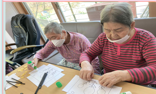
04/22 - 유채꽃 액자