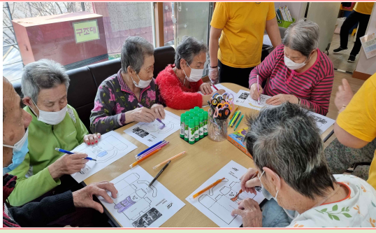
12/30 - 눈사람만들기