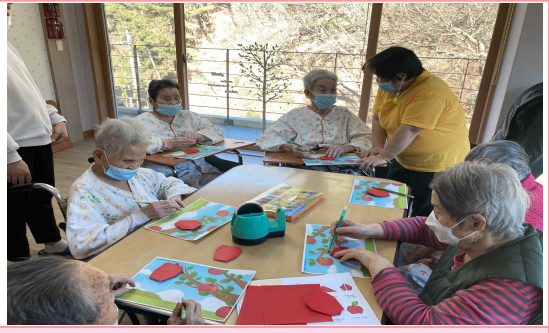
12/31 - 사과 색종이접기

저희 느티나무 안심요양시설에서는 보호자님들의 말씀 한마디 한마디를 귀담아 듣고 어르신들을 가족과 같이 따뜻한 마음으로 섬김을 실천에 옮기는 곳이 되겠습니다. 많은 관심과 배려 부탁드립니다.