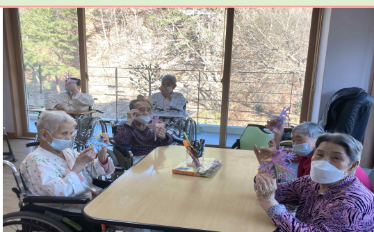
12/17 - 눈꽃발레리나