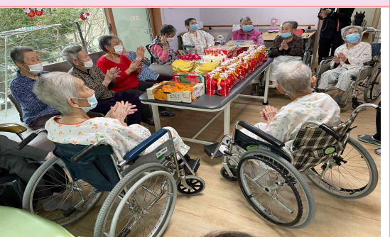
12/24 - 생신 및 크리스마스 행사